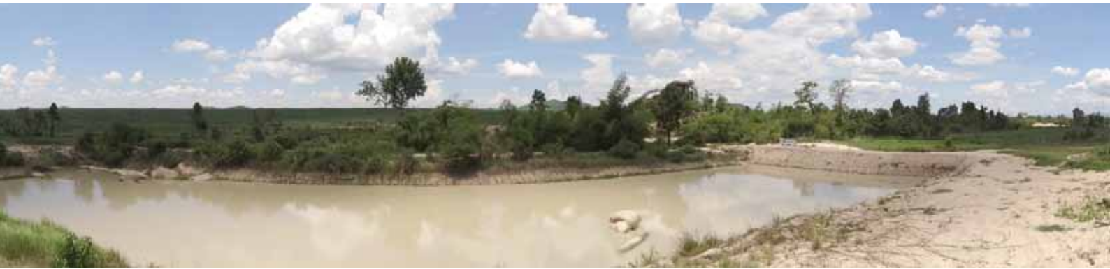
Bild 7: Ein konzernerogener Damm auf dem Gebiet der Konzession blockiert den Fluss auf seinem Weg nach La'ngim village

verloren und sind nicht mehr in der Lage, essbare Wasserpflanzen, wie etwa Wasserspinat oder Seerosearten, zu finden, die bislang vor Ort gewachsen sind. 37