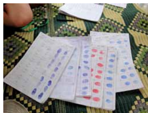
Bild 3: Daumenabdrücke, die 2010 gegen das Projekt gesammelt wurden

Um sich die Kontrolle über das Land zu verschaffen, griff das Unternehmen auf Tricks, Einschüchterung und gewaltsamen Räumungen zurück. DorfbewohnerInnen, die des Lesens nicht mächtig waren, wurden genötigt, Dokumente mit ihrem Daumenabdruck zu unterzeichnen. Ihnen wurde vom Gemeindevorsteher erzählt, dass es darum gehe, eine Straße zu bauen, ihre Landrechte zu kartieren oder dass es sich sogar um eine Petition gegen das Zuckerkonzernprojekt handele. Dabei waren es Dokumente, die die Übergabe ihres Landes besiegelten. Andere wurden bedroht und dazu gezwungen, „Kompensationsangebote“ anzunehmen, die ihnen von den Behörden im Auftrag der Unternehmen vorgesetzt wurden – einige erhielten nicht einmal das versprochene Geld. Den DorfbewohnerInnen von O’Ang Khum wurde eine inakzeptabel niedrige Kompensation vorgesetzt: 200 US Dollar pro Hektar für ihre Reisfelder, 100 US Dollar pro Hektar für anderes Land. 28 Diese „Kompensationsangebote“ wurden nach Augenzeugenberichten von Bemerkungen