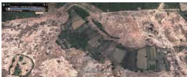
Bild 5: Wald rings um bereits geräumte Reisfelder, während ein paar Reisfelder Mitte 2010 noch existierten

Ein Dorf, Pis, wurde komplett zerstört. Ohne vorherige Ankündigung und ohne richterliche Anordnung erfuhren die AnwohnerInnen von den Zuckerkonzessionen in dem Moment, als die Bulldozer des Unternehmens und ungefähr 30 mit Gewehren und Schlagstöcken bewaffnete Soldaten im Februar 2010 anrückten, um ihr Land zu räumen und ihre Häuser zu zerstören. 32 Die militärischen Einheiten, die zum Schutz der Landräumungen des Konzerns abgestellt wurden, haben direkte finanzielle Verbindungen zu dem Unternehmen. Einige DorfbewohnerInnen wurden auf Grundstücke umgesiedelt, die zu klein sind, um ausreichend Nahrung zu produzieren (0,2 ha), und auf Land, das nicht zum Reisanbau geeignet ist (steiniger und sandiger Boden, siehe Bild 4). Einige haben eine Kompensationszahlung zwischen 20 und 900 US Dollar erhalten. 33